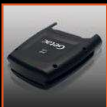
3-in-1 Card Lezer