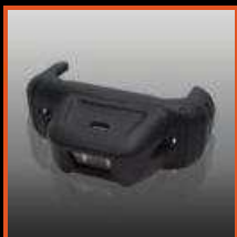
1D Barcode Lezer