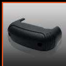
RFID Lezer of Long Range Bluetooth